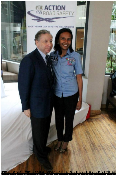
BILAN BANQUE 2016

Dimanche, 21 Mai 2017 12:39 - Mis à jour Lundi, 22 Mai 2017 05:32