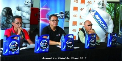
Journal La Vérité du 18 mai 2017

Dimanche, 21 Mai 2017 12:39 - Mis à jour Lundi, 22 Mai 2017 05:32