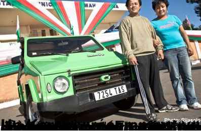
MAZANA i de nouveau en vente - Le 08/08/2013

Madagascar automobiles : que les futurs dirigeants roulent en Karenjy Mazana !